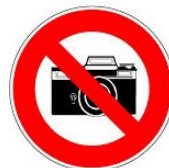
Photo interdite, sauf accord préalable de votre accompagnateur