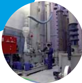
Hall Pilote de plus de 200 m 2

PRESTATIONS clé en main, même à l'international