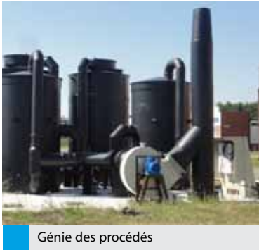
Génie des procédés