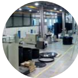
Plus de 8400 m 2 d'atelier en France