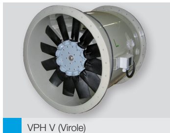
VPH V (Virole)