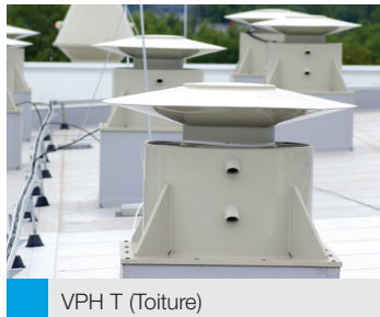
VPH T (Toiture)