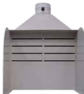
Capteur frontal d'aspiration