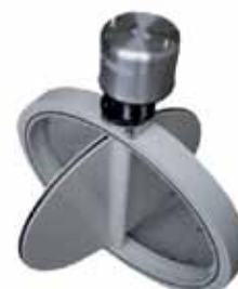
Vanne de réglage, étanche, motorisée