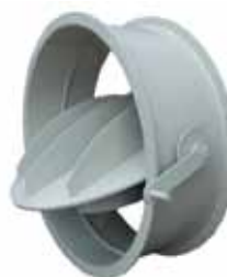
Vanne Ø 500 à 2 000 mm