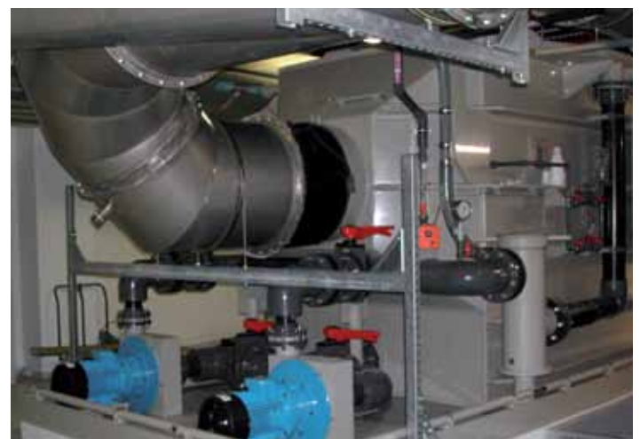
LRH, application Micro-électronique