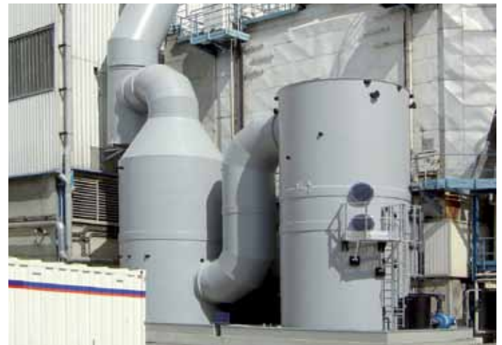
LRV, Désodorisation sur centre de transfert de déchets