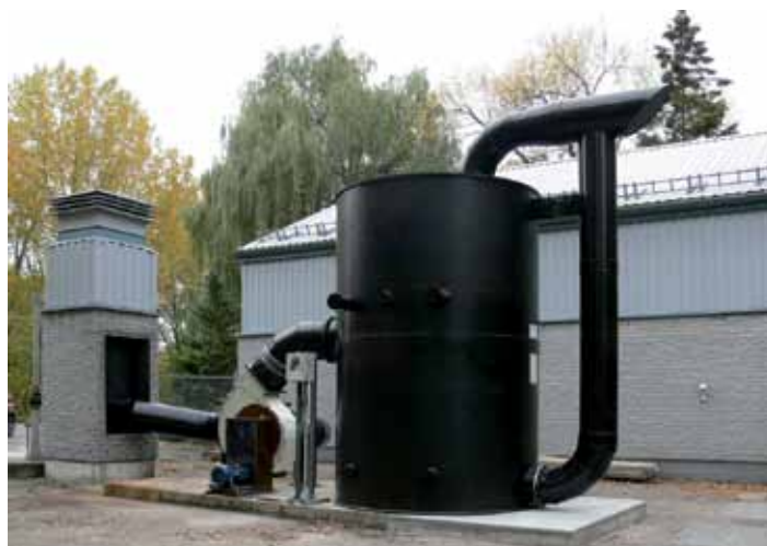
TCA double étage extérieure en STEP

NOTRE GAMME S'ADAPTE À UNE INSTALLATION INTÉRIEURE ET EXTÉRIEURE.