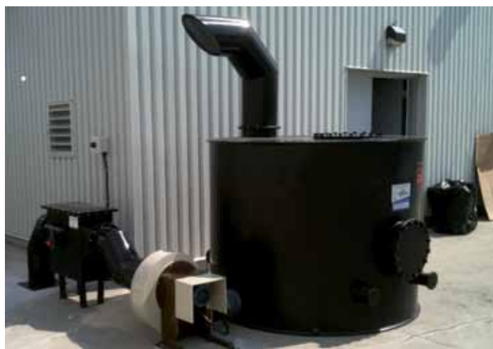
TCA, son ventilateur et séparateur de gouttes en STEP