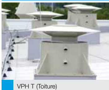
VPH T (Toiture)