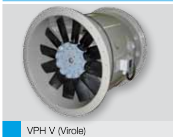
VPH V (Virole)