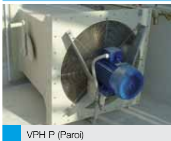
VPH P (Paroi)