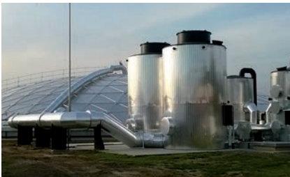
Tratamiento de agua

John Cockerill Europe Environnement pone a su disposición los equipamientos más eficientes para colectar y canalizar el aire contaminado de sus procesos hacia el sistema de tratamiento y ventilar las áreas de trabajo en numerosas aplicaciones , tales como :