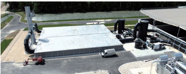
Tratamiento de residuos y compost