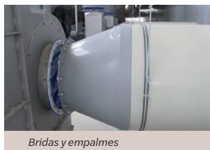
Bridas y empalmes