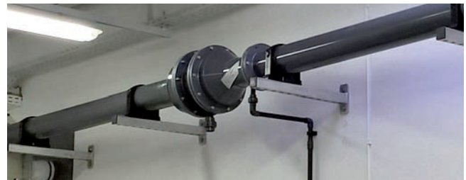
Otras industrias: curtidurías, etc.

Los procedimientos industriales generan diferentes tipos de contaminación. Nuestro trabajo es optimizar la ventilación conforme a sus exigencias y las de la normativa en vigor.