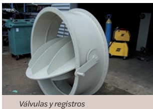
Válvulas y registros