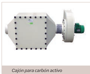
Cajón para carbón activo