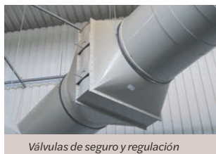
Válvulas de seguro y regulación