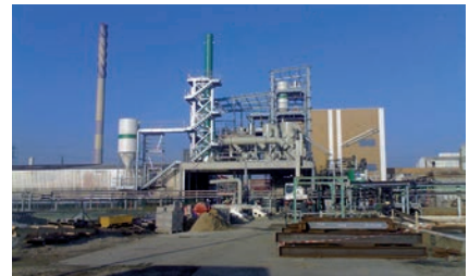
Química fina y pesada