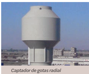
Captador de gotas radial