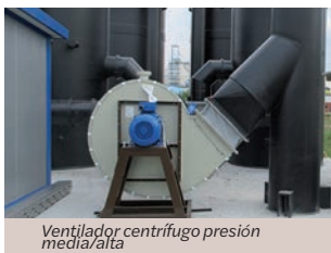
Ventilador centrífugo presión media/alta