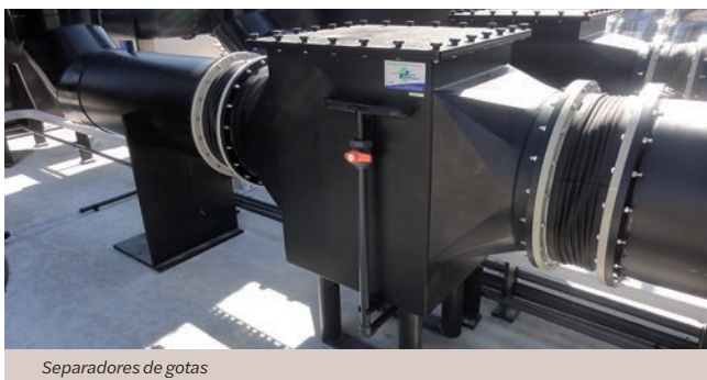
Separadores de gotas