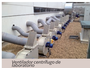
Ventilador centrífugo de laboratorio